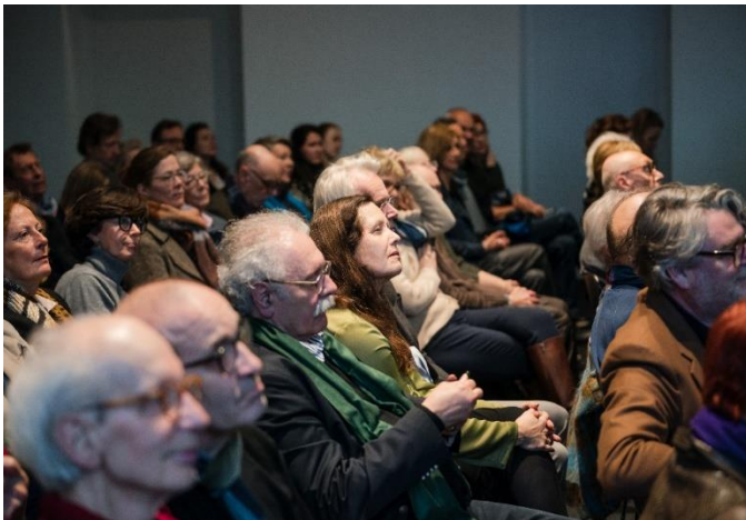
Ausgebuchtes Auditorium der Deichtorhallen Hamburg

Wir freuen uns sehr, dass die erfolgreiche Diskussions-Reihe mit den Deichtorhallen Hamburg einen so wunderbaren Abschluss gefunden hat. Jede der drei Veranstaltungen war komplett ausgebucht.