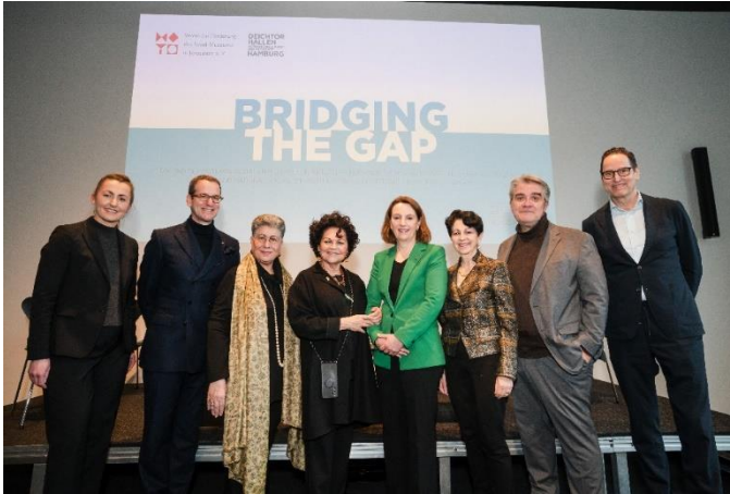
Das Panel und die Initiatoren der Dialogreihe

Wir freuen uns sehr, dass die erfolgreiche Diskussions-Reihe mit den Deichtorhallen Hamburg einen so wunderbaren Abschluss gefunden hat. Jede der drei Veranstaltungen war komplett ausgebucht.