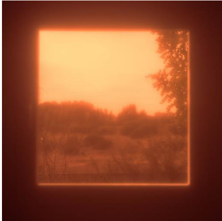
Nurit Gal, Israeli, born 1960, Mamad 3 (Safe Room), from the series „Eclipse“, 2017, Inkjet print, Collection of the artist

October 7 Special Display – Nurit Gal: Eclipse (Safe Room Series) (für weitere Infos bitte dem Link folgen)