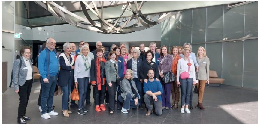
Gruppenbild vor den Deutsche Bank Towers

Zahlreiche Facetten der Main-Metropole: Atemberaubende Kunst und lebendige Kultur, umrahmt von wundervollen Begegnungen