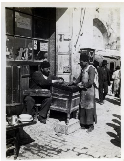
Peddler in the Old City (?), Jerusalem, 1930s / Bequest of Erich Brauer, Jerusalem, to the State of Israel, on permanent loan from the Israel Ethnographic Society