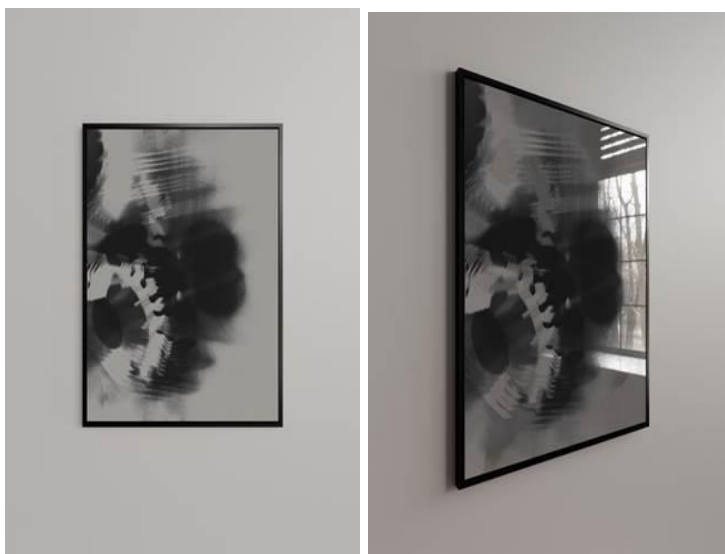
Die neue Sonder-Edition „sling of memory – inverted – after October 07, 2023 / © Ahmed Shukur

Sofern Sie Interesse an einem der letzten verfügbaren Werke haben, melden Sie sich gern bei Alexandra Stöckigt, stoeckigt.imj@step21.de .